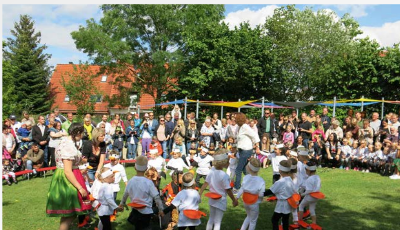
▸ Die Libellengruppe trägt „Alle meine Entchen“ vor