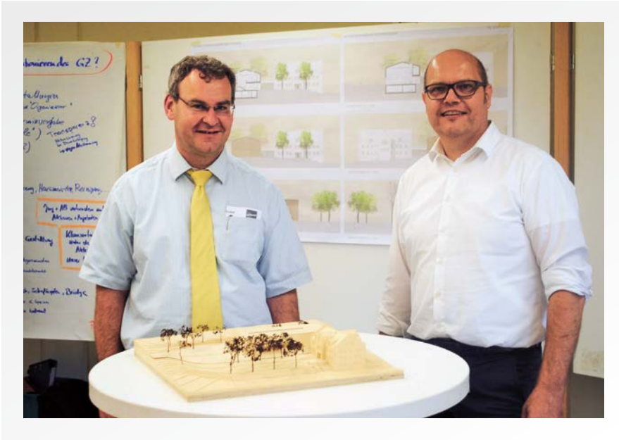
► Bürgermeister und Architekt sind mit dem Workshop und dem Ergebnis sehr zufrieden

jede einzelne Station mit der gesamten Teilnehmerschar nochmals Punkt für Punkt besprochen und die Anregungen und Vorstellungen der Teilnehmer zusammengeführt.