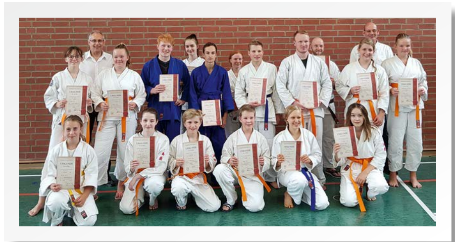
► Prüfung Juli 2019

Am Samstag den 13. Juli 2019 führte die Ju-Jutsu-Abteilung vom SV Kumhausen in diesem Jahr die dritte Gürtelprüfung durch. 16 Ju-Jutsukas und ein Teilnehmer aus Hutthurm, im Alter von 12 bis 36 Jahren, stellten sich zu ihrer nächsten Graduierung. Zum ersten Mal wurden auch Anwärter zum blauen und braunen Gürtel geprüft. Neben den geforderten Techniken für den Gelb-, Orange- und Grüngürtel mussten sich die Prüflinge noch weiteren Herausforderungen stellen. Speziell die Abwehr gegen Waffen wie Stock, Messer und Kette, wie auch die Verteidigung mit dem Stock waren ein Bestandteil dieser Prüfungsteilnehmer. Auch in den Komplexaufgaben ging es deutlich zur Sache. Gestartet wurde mit einem Faustkampf, später mit Wurfeingängen und Übergang vom Stand zum Boden. Dieser Prüfungsteil stellte besondere Anforderungen an die Ausdauerleistung der Prüflinge. Durch die intensive Vorbereitung der Anwärter, welche in den letzten zwei Monaten bis zu 5-mal wöchentlich trainierten, wurde auch dieser Teil gemeistert. Nach einer 6-stündigen Prüfung hatten alle Prüflinge ihr Ziel