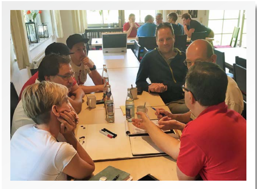
▶ Arbeitsgruppen machten sich Gedanken über die Zukunft des Sportvereins.