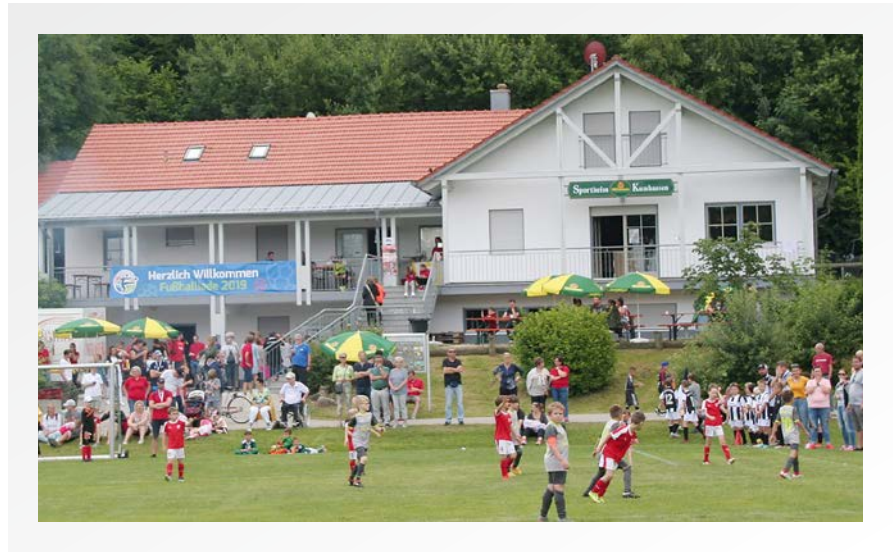
› Auf dem Vereinsgelände in Grammelkam herrschte während der Fußballiade reger Betrieb