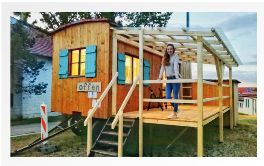
› „Einzug im Bauwagen“

Das Planen, Ausräumen, Streichen, Aus-sortieren, Schleifen und Packen gemeinsam mit den Kindern und Jugendlichen gehört nun der Vergangenheit an. Am 9. Juli 2019 sind wir offiziell in den Bauwagen in Preisenberg eingezogen. Interessierte Anwohner*innen haben schon erfahren, dass neben dem Kindergarten nun kein Waldkindergarten ist, sondern der neue Jugendtreff!