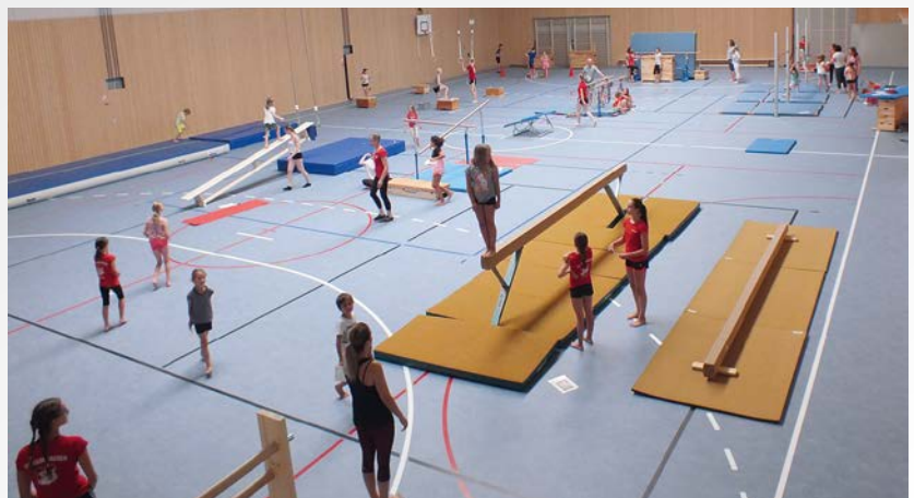
▶ Die Turnabteilung verwandelte die Halle in eine Bewegungslandschaft.