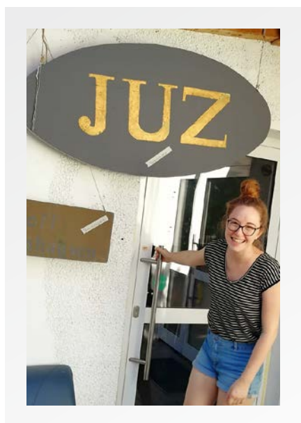
› „Die Tür ist zu“

Die Freude über ein Angebot für Jugendliche direkt in Preisenberg ist groß. Auch wir freuen uns auf eine gute Nachbarschaft sowie viele neue und bekannte Gesichter. Kommt einfach ganz ohne Anmeldung vorbei und schaut rein! Der offene Treff geht hier, während der Bauphase am Rathausplatz, wie gewohnt weiter. Jeden Dienstag von 15:00–19:00 Uhr und jeden zweiten Freitag von 16:00–21:00 Uhr ist der Jugendtreff of-