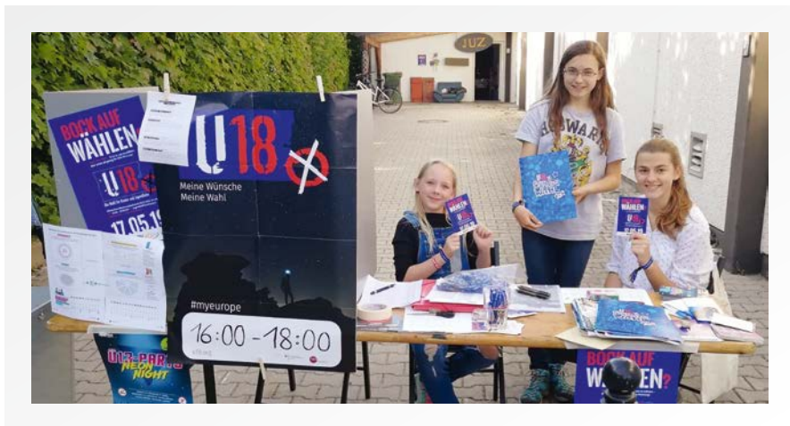
› „Wahllokal Europawahl U18“

Wir freuen uns schon auf die U18-Kommunalwahlen im nächsten Jahr!