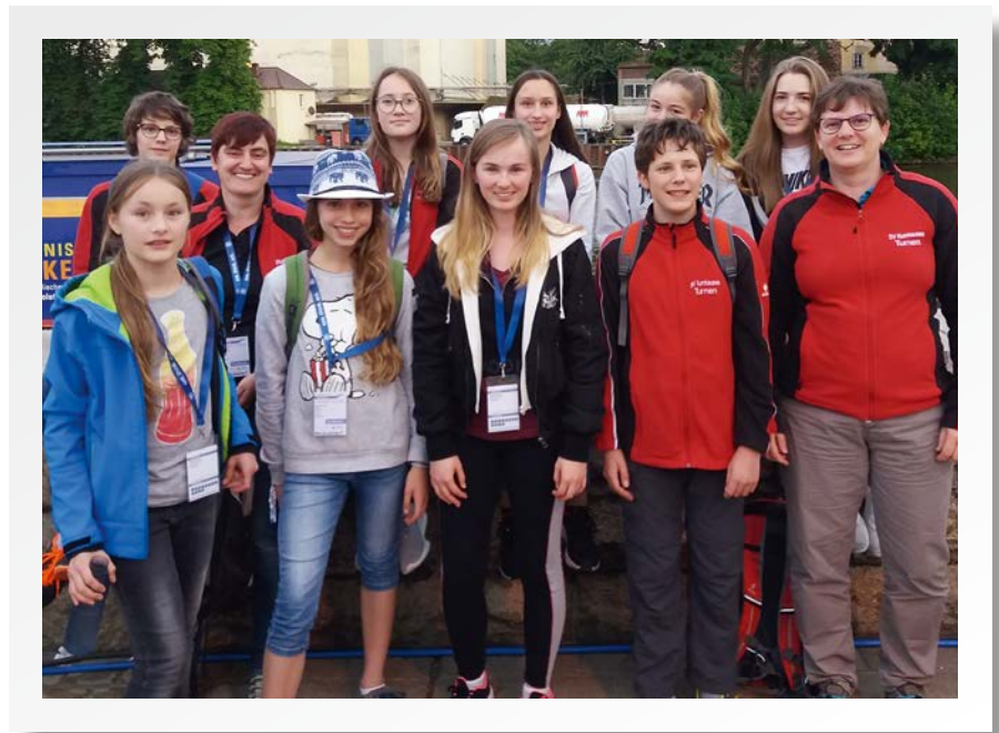
Das Landesturnfest in Schweinfurt war für die Sportler aus Kumhausen ein großes Erlebnis.

Sonntag ging es mit dem Zug, großartigen Eindrücken und schönen Erlebnissen wieder nach Hause.