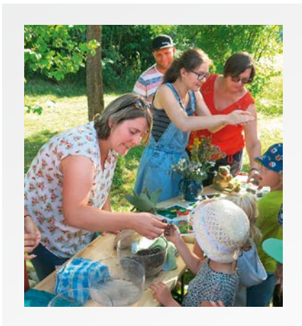
► Die Kinder bastelten unter anderem Saatkugeln mit alten bayrischen Kräutern.