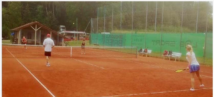
▶ Auf dem Tennisplatz gab es packende Ballwechsel zu sehen.