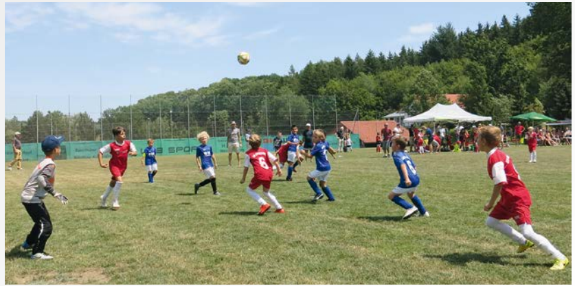
▶ Die Nachwuchskicker des SVK zeigten beim Sommerfest vollen Einsatz.

cher Auftritt: In der Gruppenrunde des Toto-Pokals ging das Team von Trainer Rudi Schöttl sowohl gegen den ETSV 09 als auch den FC Eintracht Landshut als Sieger vom Platz.