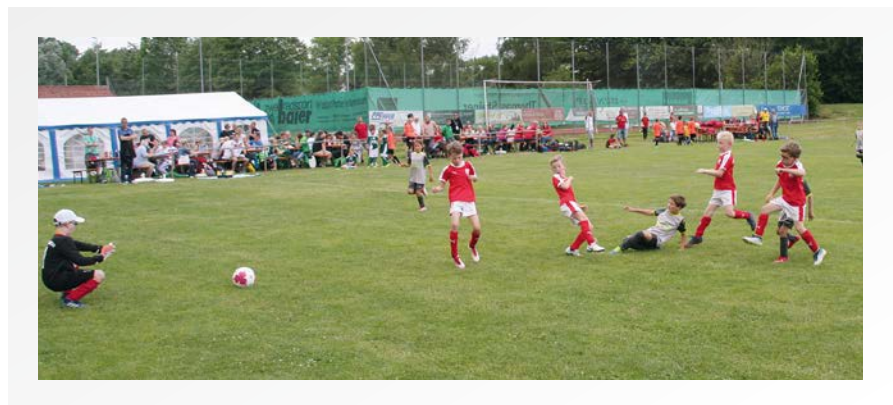
› Die Nachwuchsmannschaften lieferten sich spannende Partien